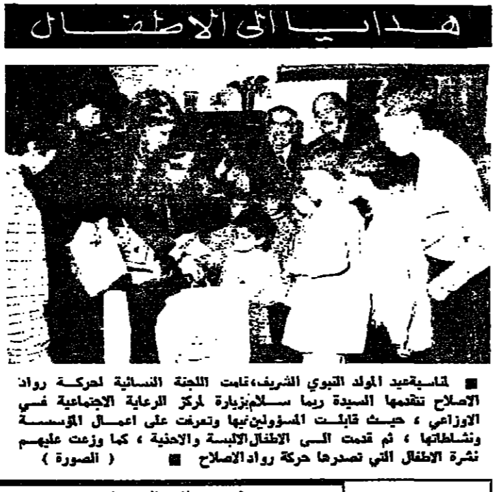
تشرع الطفلة التي تصدحها حركة رواد الاصلاح (صورة)

الاصحاب بالمسؤولين الرومانيين الا ان نطاق التدمير الحكومي واللجوء التي تصاحبه بها البيئات الريفية ويوجد بان رومانيا تواجه كارثة كبيرة. ومن الممكن ان يكون قد قتل عدد من الناس يبلغ المئات عندما اصابت الزلازل مناطق ترانسلفانيا ذات الكثافة السكانية الشديدة والواقعة الى الشمال من بوخارست ومنها ايضا اضرار بالغة في العاصمة التي يبلغ عدد سكانها 1.6 مليون نسمة. واعلنت مجلة التايم في العدد الصادر باسم الرئيس نيكولاي تشاوشيسكو الذي كان في لاغوس في نيجيريا يختم جولة في خمسة بلدان افريقية عند حدود الزلازل.